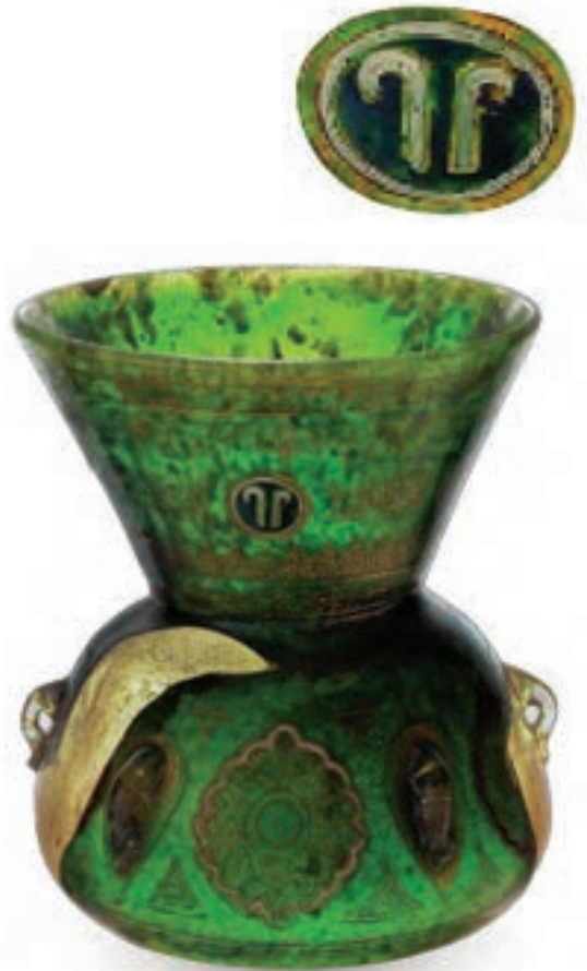
(لوحة ١٥) الجوكندار على مشكاة الأمير سيف الدين آل الملك الجوكندار، متحف الفنون الإسلامية بإسطنبول.

وأنشأ الناصر محمد بن قلاوون الميدان الناصري (٧١٢ هـ / ١٣١٢ م)، وانتهى في (٧١٨ هـ / ١٣١٨ م)، وكان هذا الميدان من جملة أراضي بستان الخشاب (١٠٨) ، وبدأ يركب السلطان إلى هذا الميدان للعب البولو كل سبت خلال الشهرين لوفاء النيل. وقد ذكر المقرئ ذلك الموكب الفخم الذي كان يخرج به السلطان للعب الكرة بالميدان الناصري، ومعه كبار الأمراء والحاشية، فكان إذا خرج للعب الكرة يفرق الحواصل الذهبية