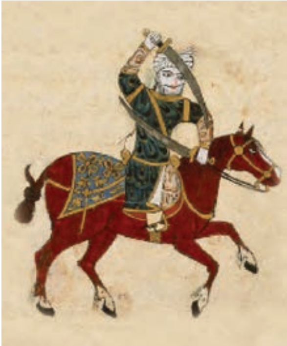
(لوحة ٧) تفاصيل من مخطوط «نهاية السؤال والأمنية في علم الفروسية».

كما تظهر المبارزة من فوق ظهور الخيل من مخطوط «كتاب المخزون الجامع للفنون» لابن خزام، مؤرخ بالسبت ٩ محرم سنة ٨٧٥هـ / ٨ يوليو ١٤٧٠ م، محفوظ بالمكتبة الأهلية ببازيس (لوحة ٦)، كما تظهر رسوم توضيحية للمخطوط بلغ عددها تسعة عشر استخداماً لمختلف الأسلحة، مثل القوس والسهم والسيف والسهم والتكتيكات العسكرية (لوحة ٧). وكذلك من بين المخطوطات التي صورت مناظر ألعاب الفروسية؛ مخطوط «تعليم الفروسية» الذي يعود إلى أواخر العصر المملوكي، ومخطوط آخر في تعليم أعمال الفروسية، ويشتمل هذا المخطوط على مناظر تمثل ألعاب الفروسية، ومن بين هذه المناظر تصويرية تمثل كيفية اللعب بالميدان، وكيفية دخول الفارس وخروجه وهو حامل سيفه ورمحه، فيظهر أربعة من الفرسان يمتطون صهوة جيادهم ويحملون رماحهم في أيديهم، ويدورون حول الميدان، وكان واحد منهم في حالة حذر شديد خوفاً من الوقوع في أي خطأ (٦٩) (لوحة ٨).