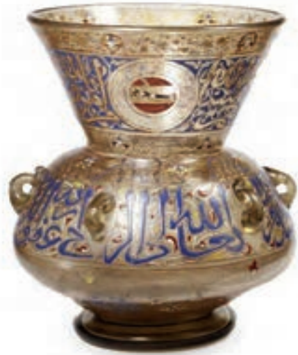
(لوحة ١٢) السلحدار على مشكاة قجليس الناصري، متحف فكتوريا وألبرت بلندن.

كما بلغت الفروسية درجة عظيمة، جعلت السلاطين والأمراء والقائمين عليها يهتمون بها اهتماماً كبيراً، فقد تفننوا في أشكالها، وأبدعوا فيها، وجعلوا منها أنواعاً وأقساماً، وتختلف أدوات الرماية المستخدمة في مجالات الرياضة عن مثيلتها المستخدمة في حالات الحروب والجهاد من حيث الخفة والرشاقة والليونة، وأول هذه الأدوات هي القسي (٨٧) . وكان من أهم أدوات الفروسية الدروع والزرود، منها درع من الزرد مؤرخ في القرن ٧ - ٨ هـ / ١٣ - ١٤ م، يعود للعصر المملوكي، مصنوع من حديد من الزرد المتشابك، من القاهرة أو دمشق، ويمكن فقط قراءة بعض الكلمات الواردة على الدرع، وهي «برسم العالي الكبير المولوي» (٨٨) (لوحة ١٣).