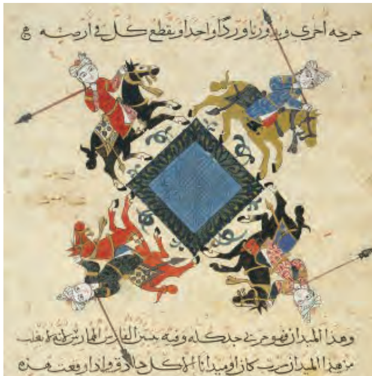
(لوحة ٨) تصويرة من مخطوط «نهاية السؤل والأمنية في علم الفروسية».