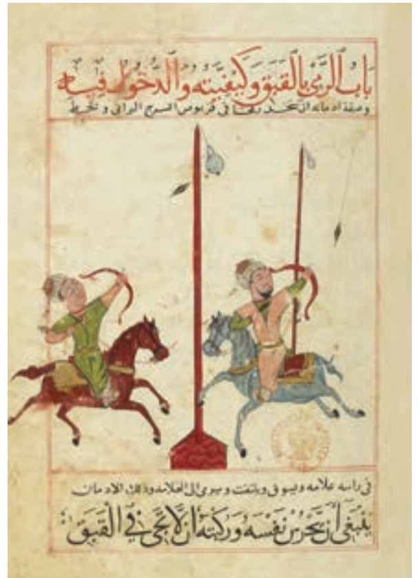
(لوحة ٢) رمي القبق من مخطوط «المخزون جامع الفنون».

ويوجد تصويرة لرمي القبق تعود إلى العصر المملوكي، يظهر فيها فرسان متواجهان يعدوان بجواديهما في وضعة الأرباع؛ حيث يحاول كل منهما إصابة الهدف الذي على هيئة قرعة عسلية مرفوعة فوق صارٍ طويل، وتكون إصابة الهدف عن طريق إطلاق سهم من قوس في يده (٥٨) (لوحة ٢).