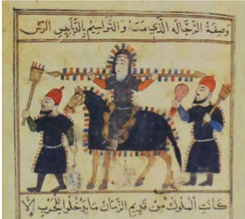
(لوحة ٩) الجمقدار، مخطوط «الفروسية والمناصب الحربية» لحسن الرماح، محفوظ في المكتبة الوطنية بباريس.