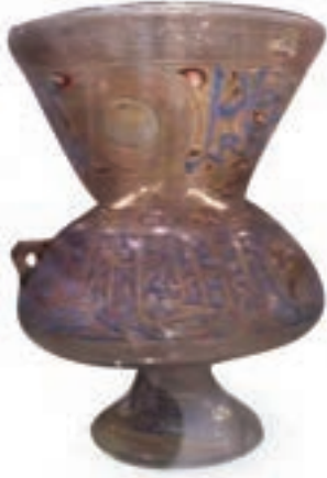
(لوحة ١١) القبقدار على مشكاة ألماس الحاجب، متحف الفن الإسلامي بالقاهرة.

العمامة (٧٥) . وأبرز الشخصيات الرياضية التي حملت وظيفة بندقدار «السلطان الملك بيبرس البندقداري»، و«الأمير إيدكين عبد الله البندقداري» هو «الأمير علاء الدين إيدكين بن عبد الله البندقداري الصالحي النجمي» أستاذ «الملك الظاهر بيبرس البندقداري» (٧٦) . وقد ظهر رنك رمي البندق على مشكاة «الأمير إيدكين البندقداري»، عبارة عن رنك القوس، ونقش عليها كتابة باسم «المقر العالي العلاتي البندقداري إيدكين»؛ رئيس فرقة رماة «الظاهر بيبرس البندقداري»، ويتألف رنك البندقدار من قوسين متدابرين متماسين بالذهب على أرضية حمراء من الميناء (٧٧) (لوحة ١٠).