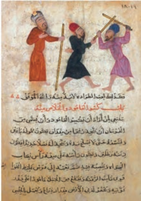
(لوحة ٥) صفحة من مخطوط في الفروسية، القرن ٩ هـ / ١٥ م.