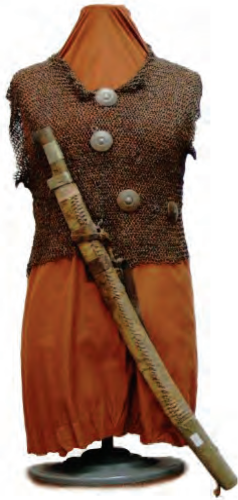
(لوحة ١٣) الدروع والسيوف من العصر المملوكي، من صناعة سوريا أو مصر، متحف الآثار الأردني بعمان، الأردن.