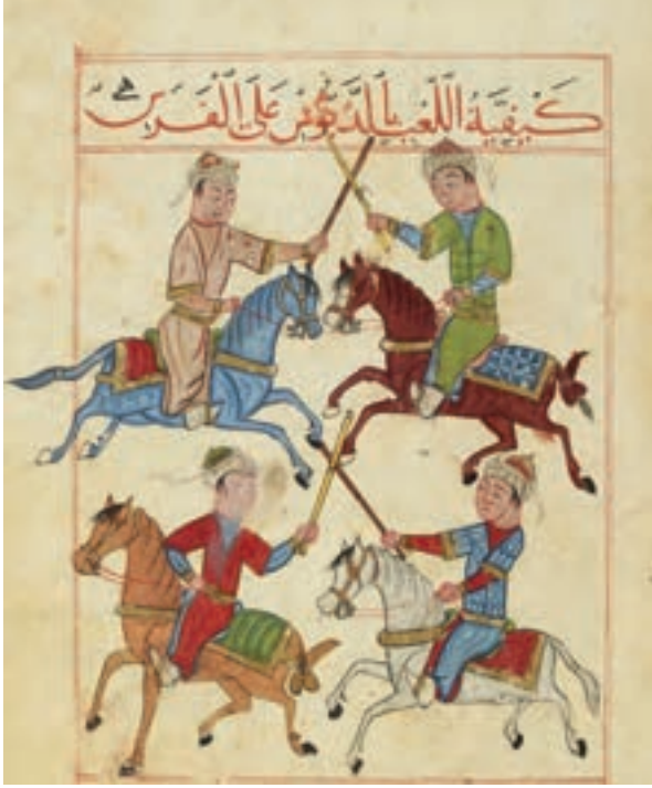
(لوحة ٦) المبارزة من فوق ظهور الخيل، مخطوط «المخزون جامع الفنون».

كما تظهر المبارزة من فوق ظهور الخيل من مخطوط «كتاب المخزون الجامع للفنون» لابن خزام، مؤرخ بالسبت ٩ محرم سنة ٨٧٥هـ / ٨ يوليو ١٤٧٠ م، محفوظ بالمكتبة الأهلية ببازيس (لوحة ٦)، كما تظهر رسوم توضيحية للمخطوط بلغ عددها تسعة عشر استخداماً لمختلف الأسلحة، مثل القوس والسهم والسيف والسهم والتكتيكات العسكرية (لوحة ٧). وكذلك من بين المخطوطات التي صورت مناظر ألعاب الفروسية؛ مخطوط «تعليم الفروسية» الذي يعود إلى أواخر العصر المملوكي، ومخطوط آخر في تعليم أعمال الفروسية، ويشتمل هذا المخطوط على مناظر تمثل ألعاب الفروسية، ومن بين هذه المناظر تصويرية تمثل كيفية اللعب بالميدان، وكيفية دخول الفارس وخروجه وهو حامل سيفه ورمحه، فيظهر أربعة من الفرسان يمتطون صهوة جيادهم ويحملون رماحهم في أيديهم، ويدورون حول الميدان، وكان واحد منهم في حالة حذر شديد خوفاً من الوقوع في أي خطأ (٦٩) (لوحة ٨).