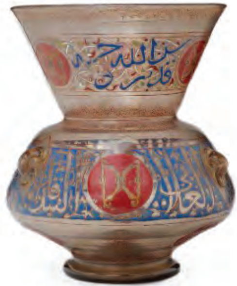
(لوحة ١٠) البندقدار على مشكاة الأمير إيدكين البندقداري، متحف الفن الإسلامي بالقاهرة.

ومن خلال هذه الدراسة يتبين أن صاحب الرمي بالقبق اختص برنك مستقل عن رنك رمي البندق؛ لذا ترجح الدراسة أن يكون الموظف المختص بهذه الرياضة كان يسمى «قبقدار» على