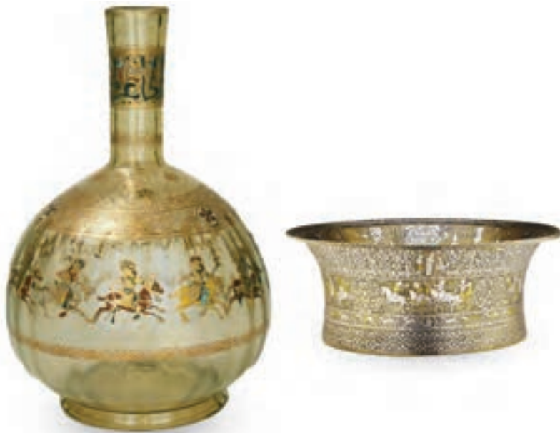
(لوحة ١٤) فروسية الكرة والصولجان في العصر الأيوبي على النحاس المكفت وعلى الزجاج المموه في العصر الأيوبي.

وقد ارتبطت رياضة الكرة والصولجان بالفروسية في مصر عبر العصور، فقد عرفها العصر الفاطمي (٣٥٨ - ٥٦٧ هـ / ٩٦٩ - ١١٧١ م)، فيذكر «ابن ميسر» أن «الخليفة العزيز بالله» (٣٦٥ - ٣٨٦ هـ / ٩٧٥ - ٩٩٦ م) أول من ضرب بالصولجان (٩٧) ، ثم تطورت هذه الرياضة في مصر خلال العصر الأيوبي (٥٦٤ - ٦٤٨ هـ / ١١٦٩ - ١٢٥٠ م)، وأصبح لها تقاليد معينة لم تكن موجودة، فقد كان من عادة السلاطين والأمراء وكبار رجال الدولة الخروج في موكب كبير مرة في الأسبوع كل يوم سبت ثلاث مرات متوالية بعد وفاء النيل لممارسة هذه الرياضة. فعلى سبيل المثال كان «نور الدين محمود» من أحسن الناس لعباً للكرة ومحباً لها، وأقدرهم عليها. وذكر «أبو شامة» عن نور الدين أنه «كان ربما ضرب الكرة، ويجري الفرس ويتناولها بيده من الهواء، ويرميها إلى آخر الميدان، وكانت يده لا ترى الجوكان فيها، بل تكون في كم قبائه استهانة باللعب». وكذلك كان «صلاح الدين الأيوبي» ماهراً في لعب الكرة، وكان يفوق أقرانه في إجادة هذه الرياضة (٩٨) ، فقد خرج في المحرم سنة ٥٧٧ هـ / ١١٨١ م إلى بركة الجب للعب الكرة، والصيد، وعاد إلى القاهرة سادس يوم من خروجه، ويذكر «ابن شداد» أن «نجم الدين أيوب» كان شديد الركض ولعباً بلعب الكرة بحيث من يراه يلعب بها يقول: ما يموت إلا من وقوعه عن ظهر الفرس (٩٩) . وقد ازدهرت فروسية الكرة والصولجان خلال العصر الأيوبي وانعكس ذلك على مواد الفنون التطبيقية، فظهرت مناظر عديدة لتلك الرياضة على الفنون الأيوبية منها: طست «الملك الصالح