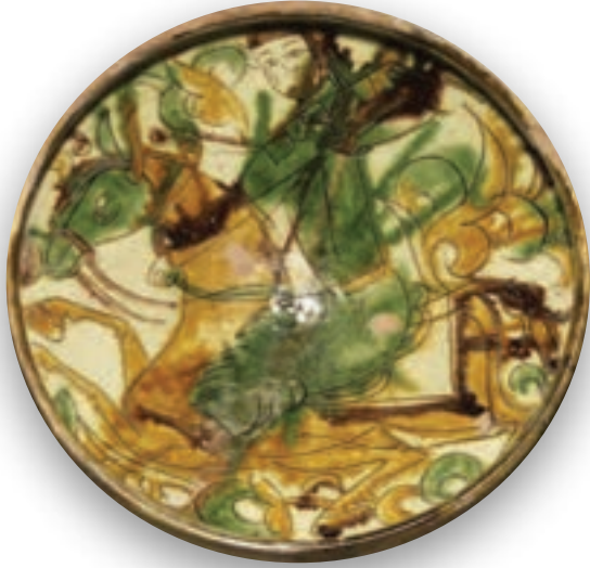
(لوحة ٣) رامى سهام على الخزف الأيوبي، القرن ٧ هـ/ ١٣ م.

وظهرت فروسية الرماية على مواد الفنون الإسلامية؛ حيث يحمل طبق من الخزف المطلبي والمزجج بالأخضر والبني منظر رامى سهام يعود إلى شمال سوريا في القرن ٧ هـ/ ١٣ م في العصر الأيوبي، محفوظ بالمتحف البريطاني بلندن (لوحة ٣).