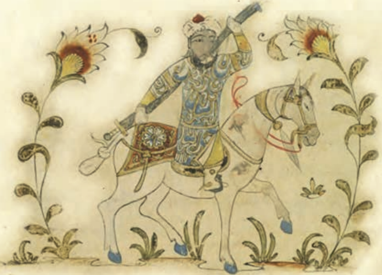
فارس يمتطي جواده، مخطوط «نهاية السؤل والأمنية في علم الفروسية».

على الأمراء، وازدهر في عصر «السلطان برفوق» (٧٨٤ - ٨٠١ هـ / ١٣٠٢ - ١٣٩٨ م) ومن بعده «السلطان المؤيد الشيخ» (٨١٥ - ٨٢٤ هـ / ١٤١٢ - ١٤٢١ م) الذي أصلح هذا الميدان وأعاد به لعب الكرة (١٠٩) . كما أقام «الناصر محمد» ميدان المهاري (٧٢٠ هـ / ١٣٢٠ م) بالقرب من قناطر السباع، وكان الناصر يركب إليه، ويلعب الكرة مع الخاصكية، وظلت الخيول في هذا الميدان حتى وفاة «الملك الظاهر برفوق» في (٨٠١ هـ / ١٣٠١ م) (١١٠) . وأقام «السلطان الناصر محمد» ميدان سرياقوس عام (٧٢٤ هـ / ١٣٢٣ م)، وانتهى من بنائه (٧٢٥ هـ / ١٣٢٥ م)، وألحق به مجموعة من القصور. فكان السلطان الناصري يخرج كل سنة من قلعة الجبل بعد ما تنقضي أيام الركوب إلى الميدان الكبير على النيل، ومعه جميع أهل الدولة من الأمراء والكتّاب، وقاضي العسكر، وسائر أرباب السير، ويسير إلى السرحة بناحية سرياقوس، وينزل بالقصور، ويركب للميدان حيث اللعب بالكرة، ويقوم في هذه السرحة أياماً، وارتبطت عادة أن ينعم السلطان على أكابر أمراء الدولة عند الخروج للصيد ولعب الكرة بسرياقوس (١١١) .