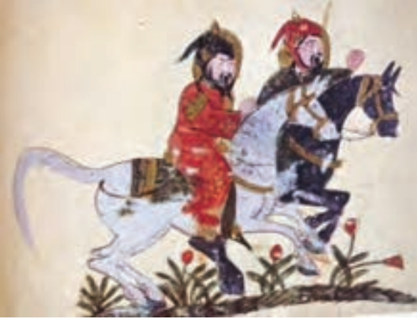
(لوحة ١) سباقات الخيل، المدرسة العربية ٦٠٦ هـ / ١٢١٠ م.