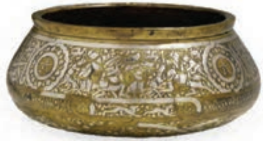
(لوحة ٤) الرماية على طست من العصر المملوكي، متحف الفن الإسلامي ببرلين.

ويظهر في المخطوط تصويرة تمثل ثلاثة فرسان من المماليك؛ اثنين منهما يتبارزان بالعصي، ويرتدي كل منهما ثوباً يصل إلى الركبتين، وغطاء رأس تشير إليه المصادر التاريخية باسم «الزمت»، ويرتدي الشخص الثالث عمامة وثوباً طويلاً ضيق الكمين، ويتكئ على عصا وكأنه يراقب المتبارزين، ويبدو أنه مدرّبهما (لوحة ٥).